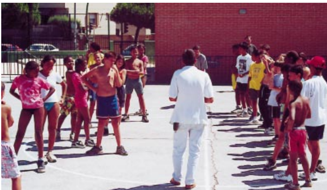
Escuela de Verano de Pozuelo, hacia la integración de culturas.

el valor básico, primario, a partir del cual se puede acceder a los demás valores. En los países donde se asienta la Democracia, aunque con sus imperfecciones en su proceso de desarrollo, cobra especial sentido la dignidad humana, cada ciudadano tiene derecho a ser respetado, a ser tenido en cuenta. No hay desarrollo sin democracia; no hay democracia sin desarrollo. Esto es